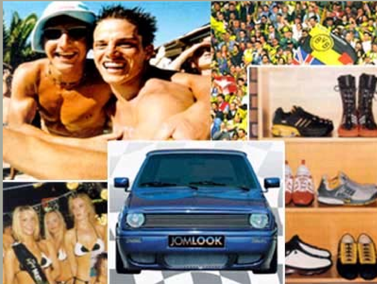
Cluster 3: Jugendkulturelle s Spaßmilieu EKD-KMU IV