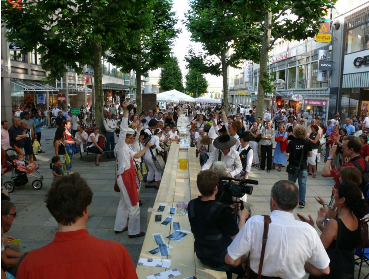
Kirche Milieus übergreifend: Kunstaktion „Der längste Altar“, Stuttgart 2008