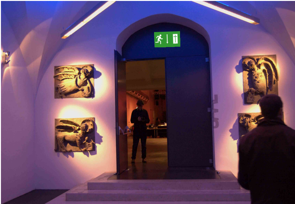
Foto-Collage: Eingangsbereich der Jugend-Kultur-Kirche Sankt Peter in Frankfurt mit dem Logo der Kirchentrojaner